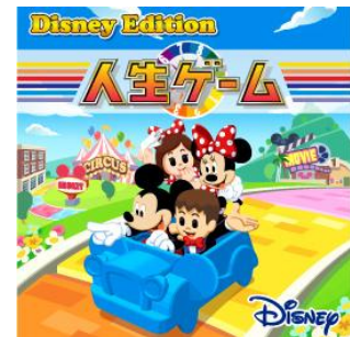
「人生ゲーム ディズニー版 お試しアプリ