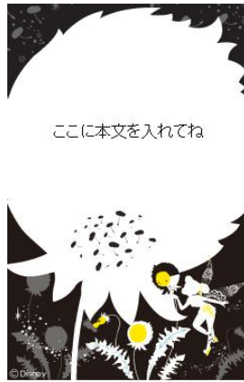
デコレメール テンプレート