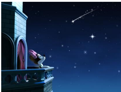
内蔵オリジナルムービー 「Sparkling Wish」