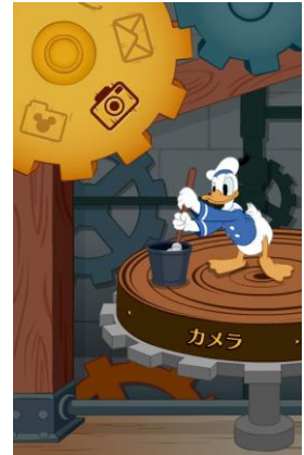
きせかえアレンジ 「Clock Cleaners」