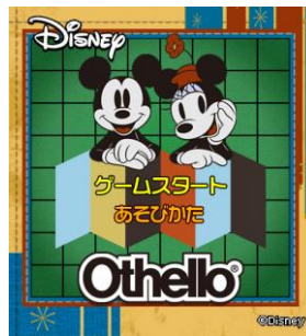
ディズニー オセロ