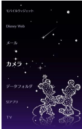
きせかえアレンジ 「Sparkling Diamond」

また、ディズニーのキャラクターと対戦できる「ディズニー オセロ」や、「人生ゲーム ディズニー版 お試しアプリ」を DM005SH にプリインストールしています。