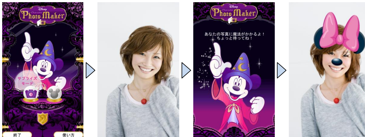
ディズニー・キャラクターフォトメーカー

ディズニー・キャラクターフォトメーカー: 撮影後の画像を使って、好きなキャラクターのなりきり画像を作ることができます。被写体がどのキャラクターに似ているかを自動判定する「サプライズモード」を選ぶと、全部で 50 種類の中からどんなキャラクターになるかを楽しむことができます。出来上がった画像はメールで友達に送信することができます。