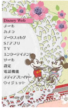
きせかえアレンジ 「Four Seasons」