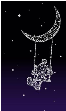
ラグジュアリー アニメーション